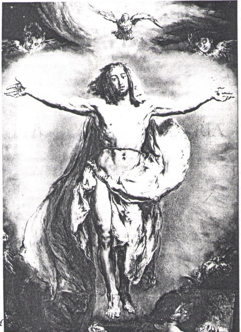
Jan Matejko: Zmartwychwstanie

W NUMERZE: O cenie wody w Bychawie s. 3 ❀ Ogłaszamy KONKURS – na str. 4 ❀ Ciekawe spotkania – s. 5 ❀ Podstawówka – i co dalej? s. 6 ❀ W Leśniczówce i Skawinku nie czekają – s. 7 ❀ Oddajemy głos policji s. 7 ❀ „Chodzenie za jajami”, Sport s. 8 ❀